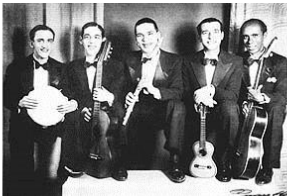
Regional do Benedito Lacerda